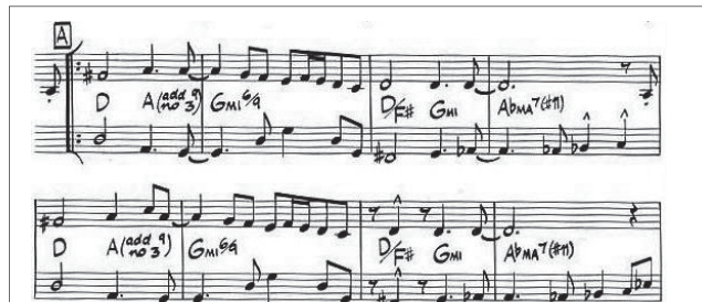
Pr. 1 Ukážka témy Looks Like Meringue (album Who's Who? , Arista Novus 1979)

nie Scofieldovho tria s basgitaristom Stevom Swallowom a bubeníkom Adamom Nussbaumom (albumy Bar Talk , Shinola a Out Like a Light ). O 11 rokov starší Swallow sa stal Scofieldovým mentorom a jedným z mála hudobníkov, ktorí ho sprevádzali počas celej hudobnej kariéry. „ Steve je ten najlepší basgitarista, akého si len môžem želať, a keď ho mám vedľa seba, cítim sa na pódiu bezpečnejšie, “ vyznal sa Scofield v nedávnom rozhovore pre časopis .týždeň . Nussbaumu neskôr nahradil Bill Stewart a rytmický tandem Stewart – Swallow sa stal v posledných rokoch dôležitým základom Scofieldovej kapely.