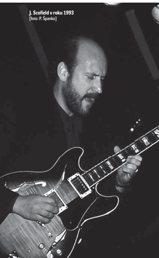
J. Scofield v roku 1993

→ žením nástrojov na nahrávke (podobne ako v časoch vzniku stereo záznamu koncom 50. rokov sú bicie vpravo, klavír vľavo, gitara a saxofón v strede). Hviezdne obsadenia prinášajú aj albumy Oh! (Blue Note 2002) kvarteta Scolofoho (Scofield, Lovano, Holland, Foster) alebo A Moment's Peace (EmArcy 2011) so zvukomalebnou hrou excelentného bubeníka Briana Bladea. Vybočením bola spolupráca s britským skladateľom Markom-Anthonym Turnageom na projekte Scorched (SCOfield ORCHEstratED, Deutsche Grammophon 2003). Nešlo tu len o spojenie štýlov, ale o skutočné prepojenie minulosti s prítomnosťou (nekonvenčného skladateľa Scofield označil ako Stravinského súčasnosti). V poslednom období prekvapoval gitarista svojich fanúšikov návratmi ku koreňom: po azda najkomerčnejšom projekte That's What I Say: John Scofield Plays the Music of Ray Charles (Verve 2005) prišiel s naplnením svojho sna – nahráť album inšpirovaný bluesovou hudbou a gospelom ( Piety Street , EmArcy 2009).